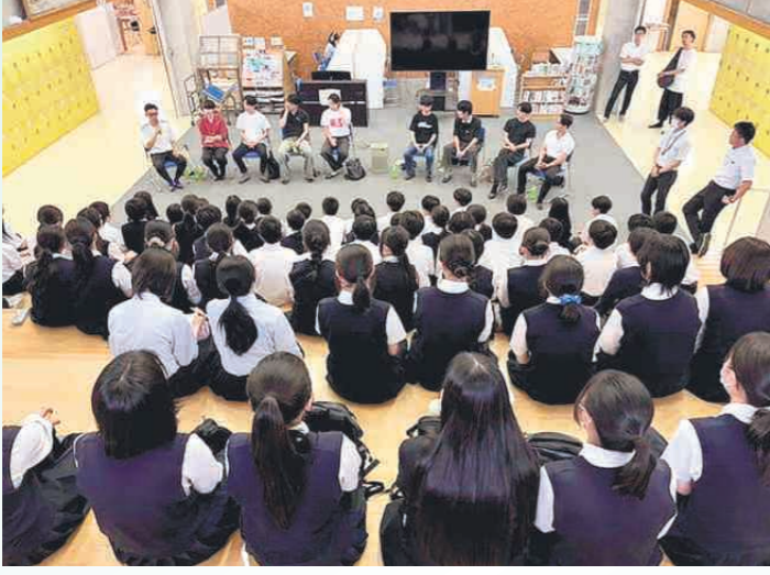
探究活動で、講師から説明を受ける生徒たち