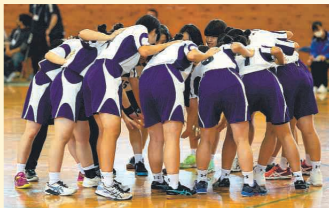
円陣（えんじん）を組んで、声をかけ合うハンドボール部員たち